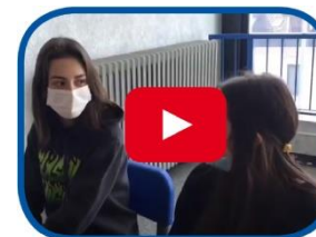
Video Inquinamento o riscaldamento?