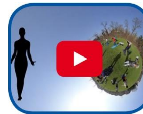
Video cosa respiriamo