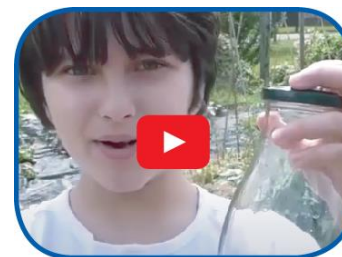
Video la qualità dell'aria: misurala per conoscerla