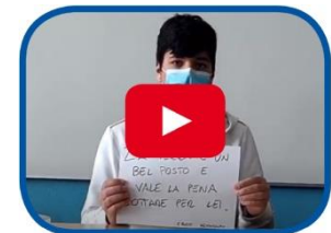
Video il verde urbano e il digitale sono per tutti