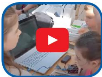
Video progetto Milano Smart Park

Lo strumento utilizzato è la Centralina per il Monitoraggio della Qualità dell'Aria