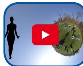
Video cosa respiriamo