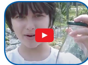
Video la qualità dell'aria: misurala per conoscerla