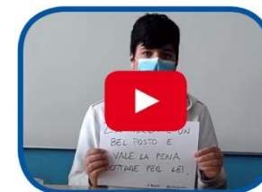
Video il verde urbano e il digitale sono per tutti