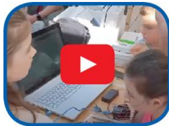
Video progetto Milano Smart Park