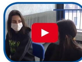
Video Inquinamento o riscaldamento?